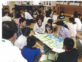
保護者や地域の方々など意見交換する子どもたち