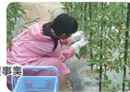
アグリパークでの収穫作業