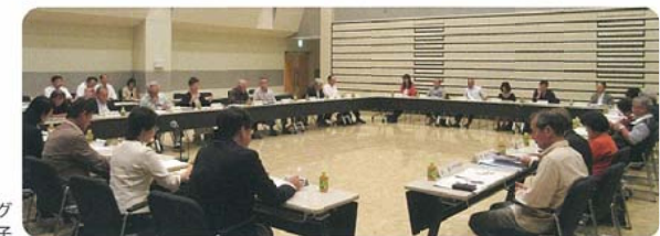
区教育ミーティ ングの様子