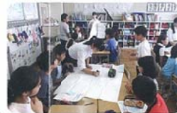
一つの課題に 取り組む小中学生