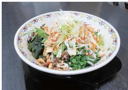
▲麵職 夷霧来のメニュー