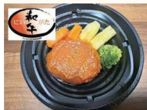
▲にいがた和牛煮込みハンバーグ