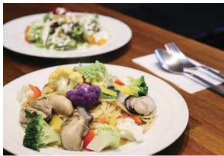
▲トラットリア アズーリのメニュー