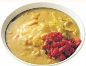
▲バスセンターのカレー