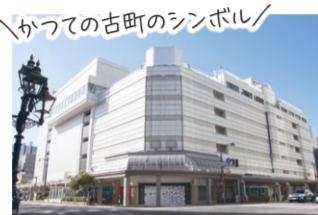
現在の旧新潟三越