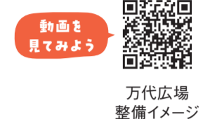
動画を 見てみよう 万代広場 整備イメージ