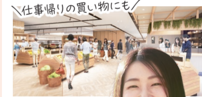
生鮮食品売場完成イメージ