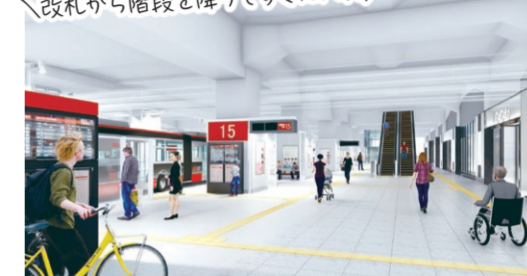
駅バスターミナル完成イメージ