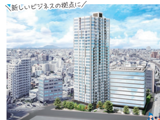
マンション・オフィスビル完成イメージ