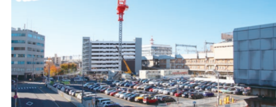
現在の新潟駅南口西地区