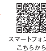
スマートフォンは こちらから

昨年3月に「新潟駅・万代地区周辺将来ビジョン」を策定し、同地区周辺の将来の姿や方向性を決めました。万代シティストリートは「体験型・時間消費型のエリア」として、多様な来訪者が居心地良く楽しく回遊できるまちづくりを進めています。※同ビジョンは新潟市ホームページに掲載