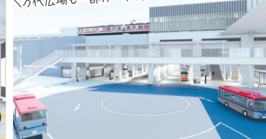
万代広場から見た駅バスターミナル(イメージ)