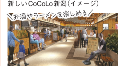
横丁ゾーン完成イメージ