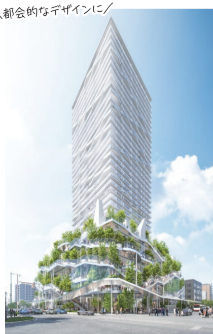
複合型施設完成イメージ

商業施設だけでなく、オフィスや住宅など複合的な用途があることで、昼間人口・定住人口を増やし、古町エリア全体に新しい活気を生み出すことが期待されています。