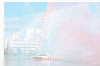
過去の一斉放水の様子