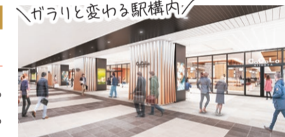
新潟駅東改札から見た新しいCoCoLo新潟(イメージ)

好きな正月の食べ物 のっぺ、栗きんとん 今年の控 アルビレックス新潟のawei ゲームにたくさん行く