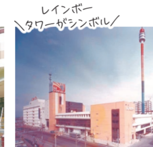
レインボー タワーがシンボル