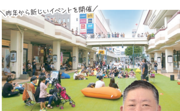
万代ホコテンの様子

買い物や食事に来たついでに、居心地の良い場所や開催中の催しを楽しんで帰れる、そんな体験を皆さんに届けられるよう、積極的にイベントの企画や情報発信を行っています。ぜひ今年も、万代シティへたくさん遊びに来てください。