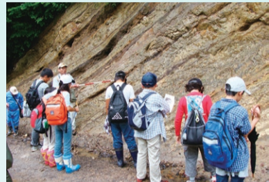
▲同会は新津丘陵をフィールドに、専門的な知識を生かした地層の観察学習などを行う

▲「この春、友の会で『新津丘陵の地質と石油』を刊行しました。多くの人に読んでもらいたいです」