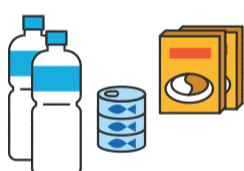
1週間分の食料や日用品