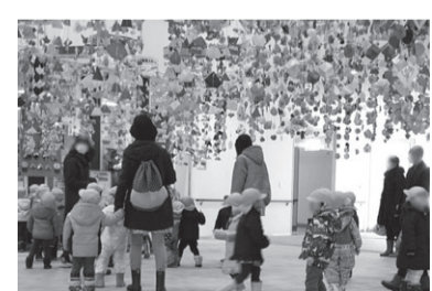
▲新津地域交流センター