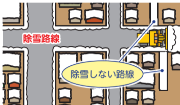
▲道路の利用状況や除雪車の大きさなどに応じて除雪する路線をあらかじめ決めていきます(図は一例)

新潟市では冬期の安全な道路交通確保のために、除雪路線や出動基準などを定めた「道路除雪計画」を毎年策定しています。この計画に基づき、事業者に協力してもらい除雪作業をします。