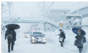
▲車道を歩く人たち