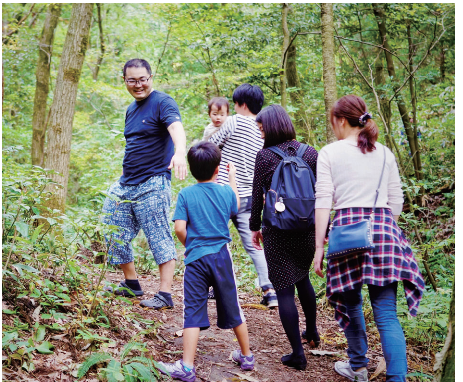
写真右上から時計回りに、秋葉区の里山、◆移住体験ツアーの様子、◆Akiha放課後里学校(同区朝日)に通う児童たち ※◆は2面で紹介