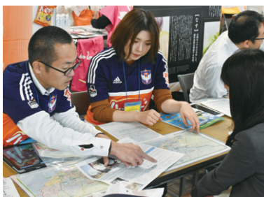
首都圏での移住希望者向け説明会の様子

移住モデル地区に指定した地区の情報は、移住希望者向けの説明会などで積極的に紹介していきます。