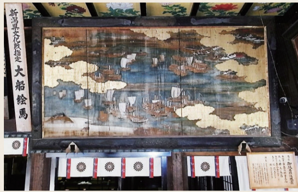
日本遺産構成文化財の一つ「大船絵馬」(白山神社所蔵)