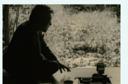
八一肖像写真 (濱谷浩撮影©片野恵介)

日 3/24(日)まで ¥一般500円、大学生300円、高校生200円、小・中学生100円 ※土・日曜、祝日は小・中学生無料。写真コンテスト入賞・入選作品展を同時開催