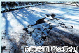
内藤武通「春の訪れ」