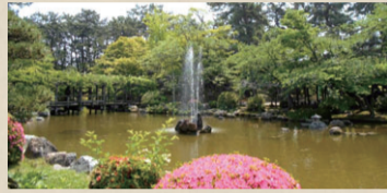
現在の白山公園 ひょうたん池と噴水

ふさわしい街にするために行った文明開化政策の一つでした。赴任直後から着工し、明治6年に公園設置奨励の太政官布告が出るとすぐに申請し、同年認可された25カ所のうちのひとつとなりました。他の公園が社寺の境内や城跡をそのまま利用したのに対し、白山公園は計画的かつ人工的に造営された最初期の公園として、日本公園史上極めて重要です。また、図から分かるように、築山や池など、造営当初からの基本的な地割りが大きく変わることなく現在も維持されているのは、奇跡的なことです。開園から145年。これからも皆さんに愛される白山公園であり続けてほしいと願っています。