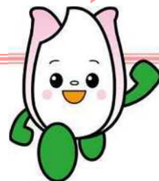
新潟市食育・花育推進キャラクター まいかちゃん