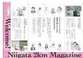
メディアフレームのイメージ