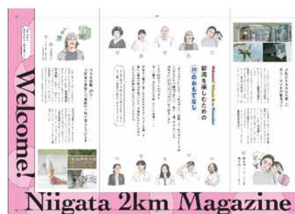
おもてなしプラン掲出イメージ