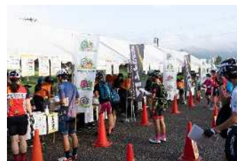
《過去の大会の様子》