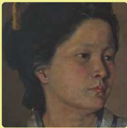
佐久間文吾《団扇をもつ少女》1888年（部分）