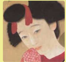
樋口富麻呂《憶い》大正初期（部分）