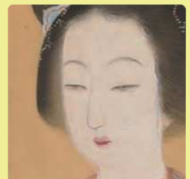
Nunobiki Hironobu 《雪月花幻想》中幅、大正末期（部分）