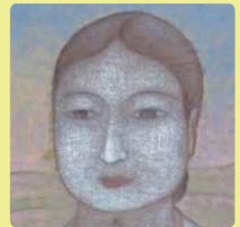
秦テヲ《瓶原（みかのはら）母子像》1923年（部分）