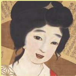
緒方文年《女》1915年頃（部分）