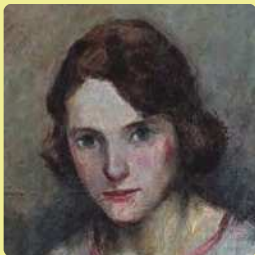
跡見泰《田舎の娘》1923年（部分）