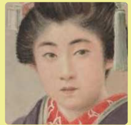
作者不詳 (Tani) 《客を迎える少女》明治後期（部分）

〒951-8556 新潟市中央区西大畑町 5191-9 tel: 025-223-1622 fax: 025-228-3051 e-mail: museum@city.niigata.lg.jp www.ncam.jp facebook @ncam.tsunagaru Instagram @ncam_official