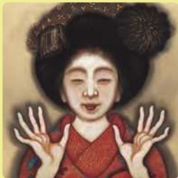
岡本神草《春の舞妓》1922年頃（部分）