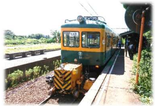
(車両移動機「アント」とかぼちゃ電車)

【試運転】 令和5年9月2日(土)午後1時～ 9月3日(日)午前10時～ ※小雨決行、荒天中止 ※イベント関係者・取材関係者のみ