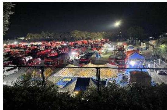
※訓練イメージ写真