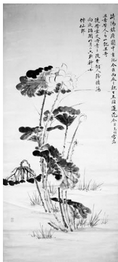
崎陽並頭蓮華図(当館蔵)