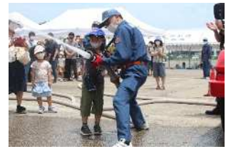
ちびっこ消防団（放水体験）