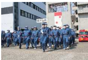
分列行進（一斉行進）