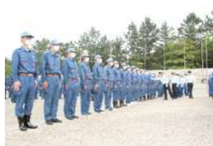
通常点検（規律の保持）