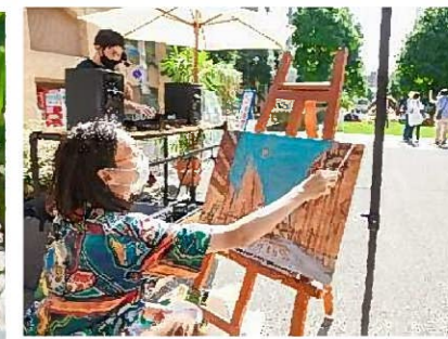
ライブペインティングや音楽演奏等を実施