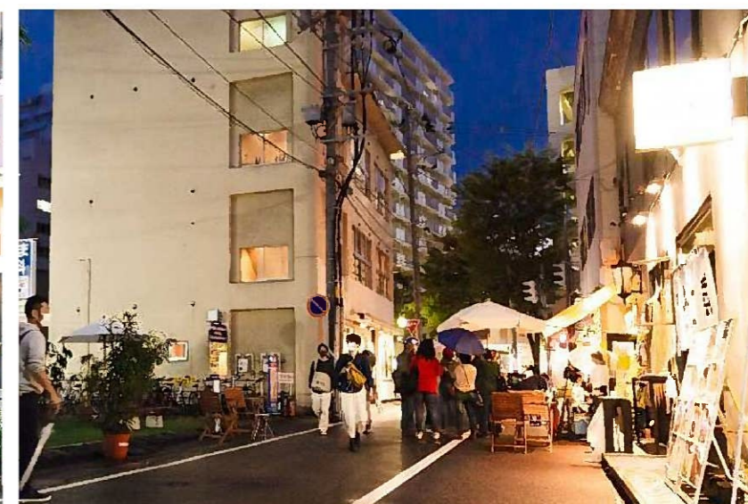
沿道飲食店では、社会実験の実施に合わせて音楽演奏会を開催