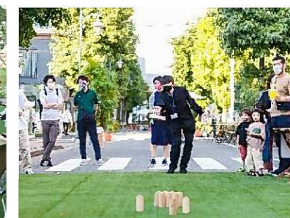
モルックを楽しむ様子