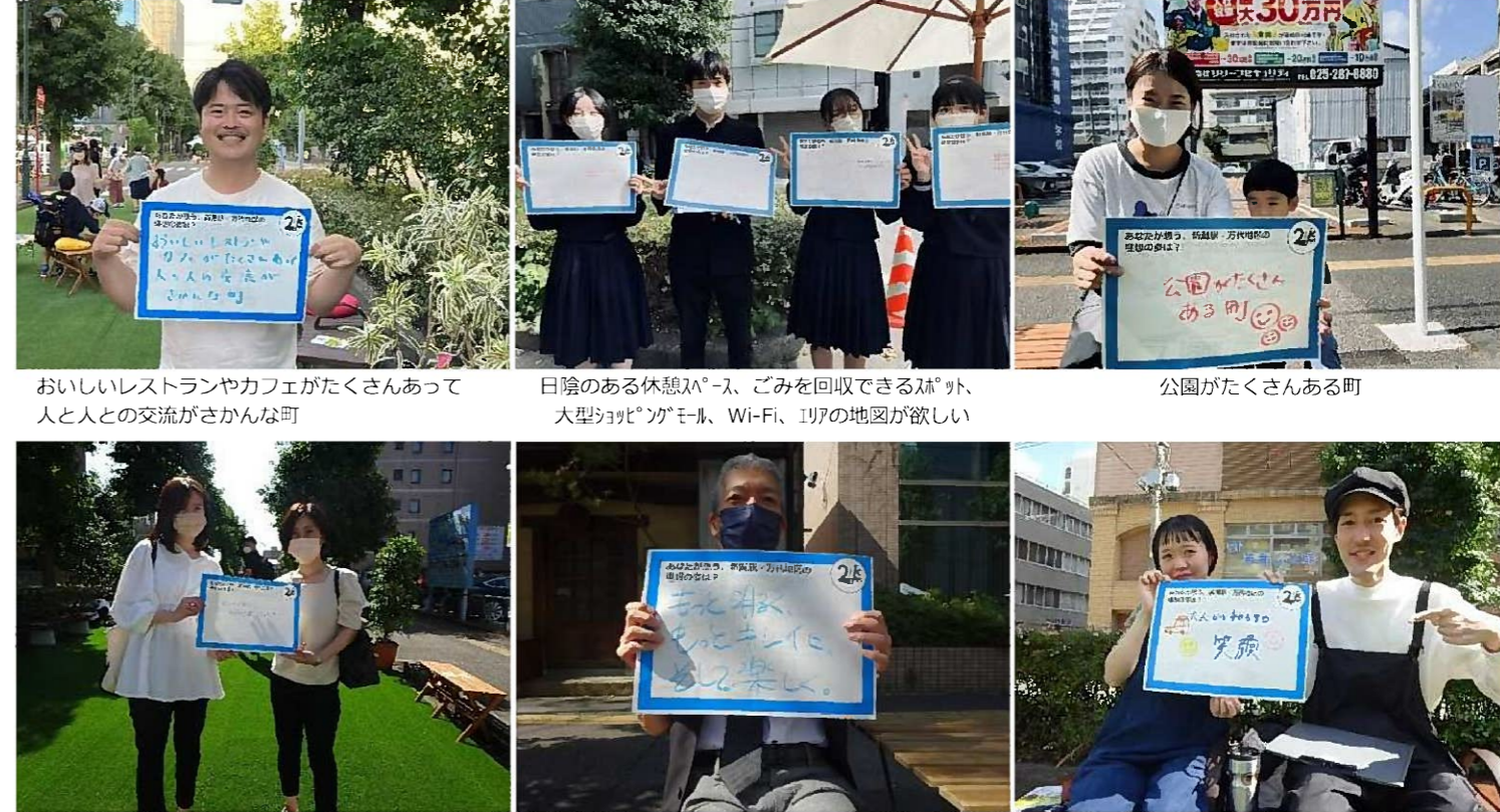
おいしいレストランやカフェがたくさんあって 人と人の交流がさかんな町