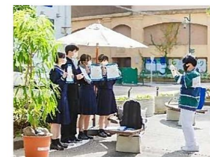
専門学校の生徒たちが、会場の設営や利用者へのアンケート調査などを行った