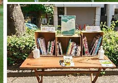
図書館の団体貸出を利用 絵本や情報誌など計100冊を用意