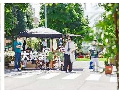
アートブースの展示