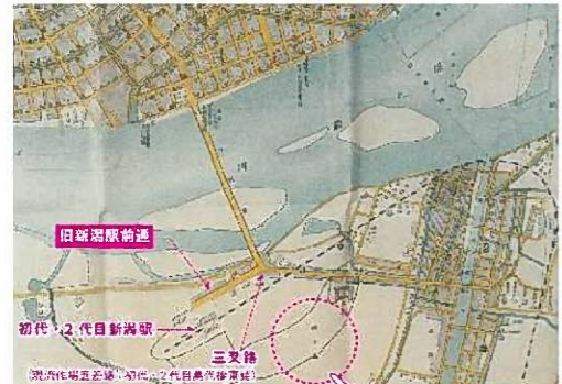
「流作場」の地名がある

流作場あるまのマップを紹介し、その歴史や文化、そして流作場の魅力を伝えることができます。