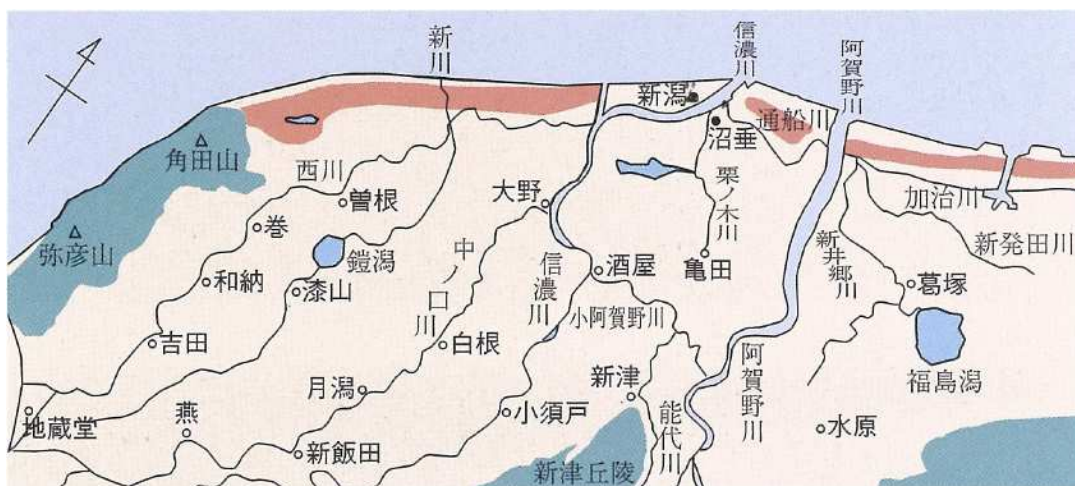
図 近世の在郷町（図中の○）