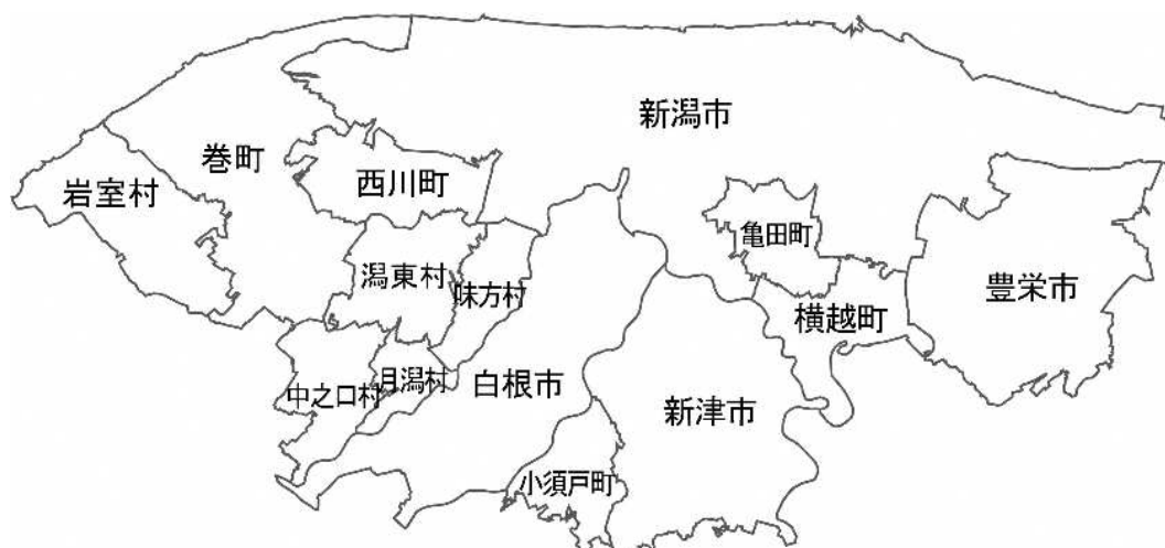
図 合併前の旧市町村の位置図