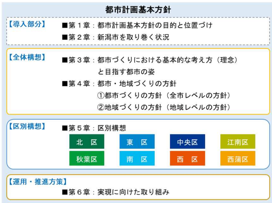
図 都市計画基本方針の構成

「運用・推進方策」では、全体構想で掲げる将来像を実現するための実現に向けた取り組みなどを示します。