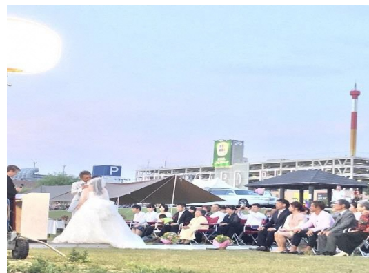
・ウエディングパーティー