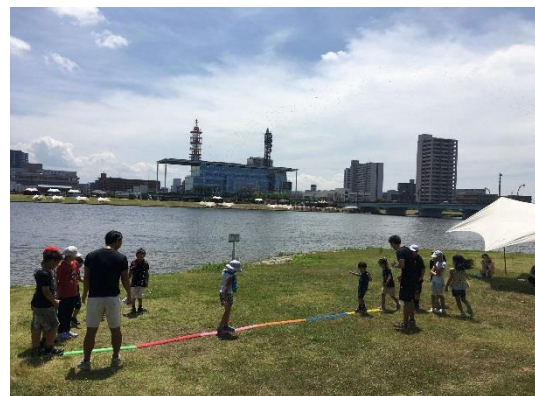
・キッズコーディネーション