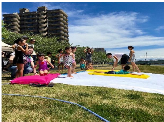
・ウォーターパーク