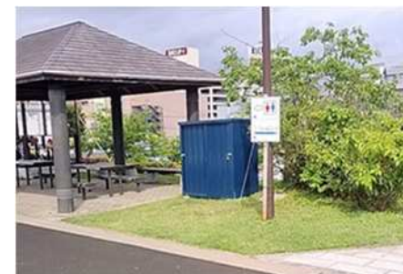
案内看板設置状況