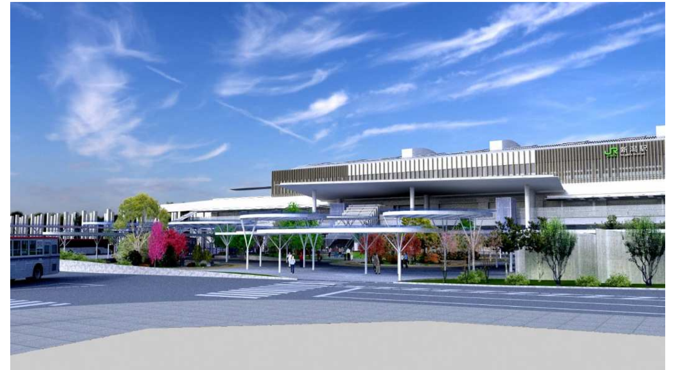
⑤ マルカビル側から