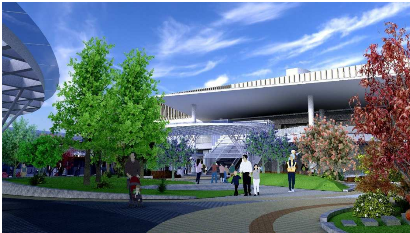
⑥ 広場中央付近から駅舎方向