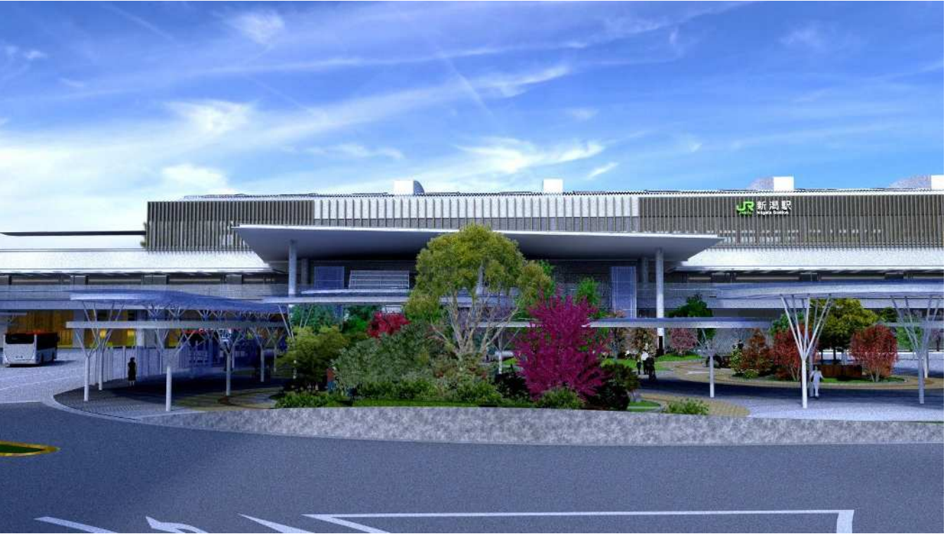
② 東大通から駅舎方向