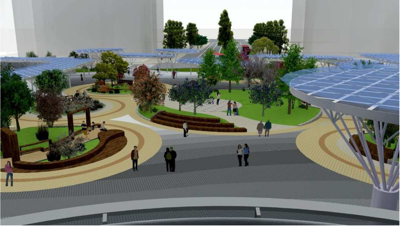
① 駅舎側2階ペDESTリアンデッキから広場と東大通方向