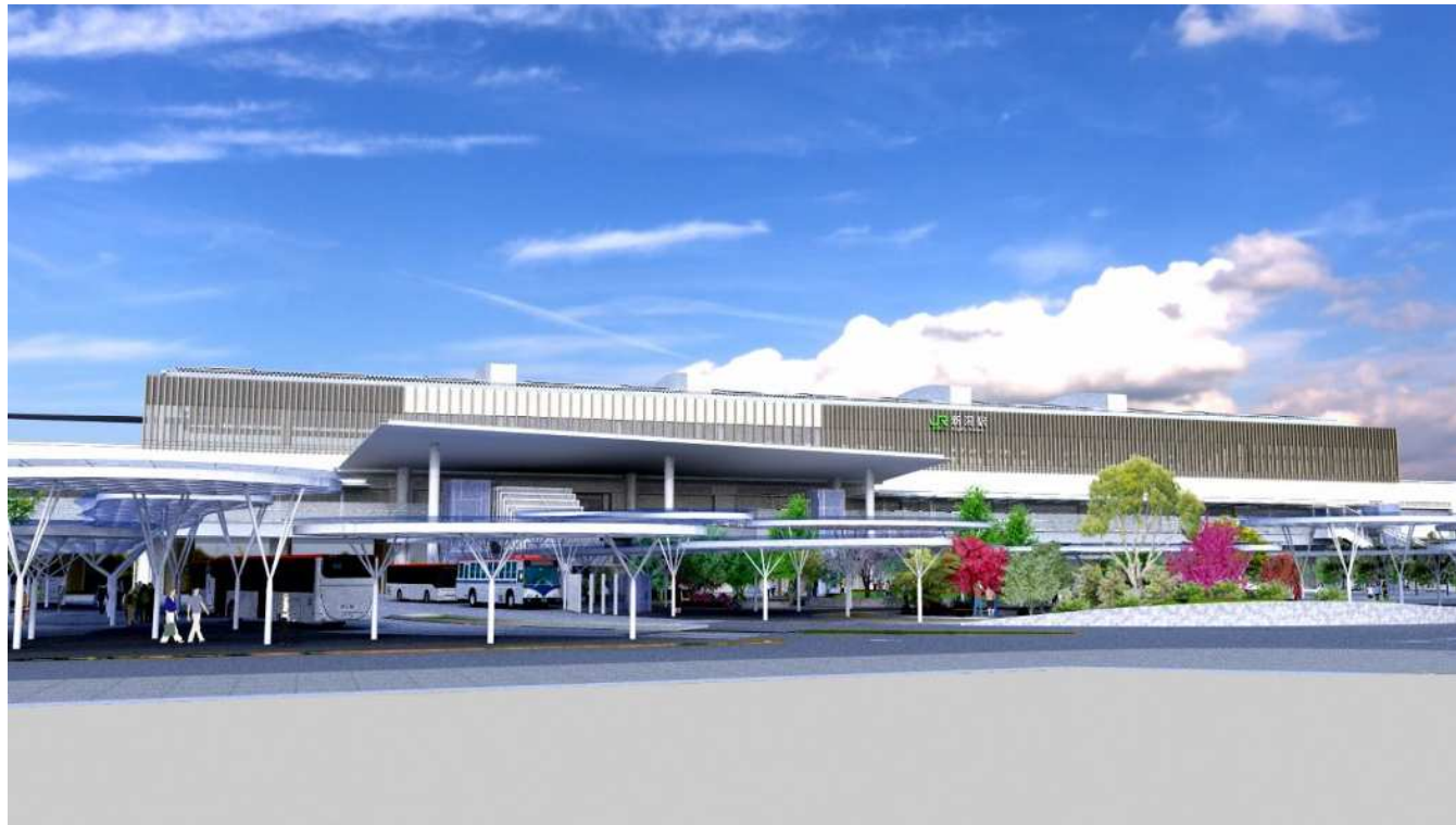
④ マルタケビル側から