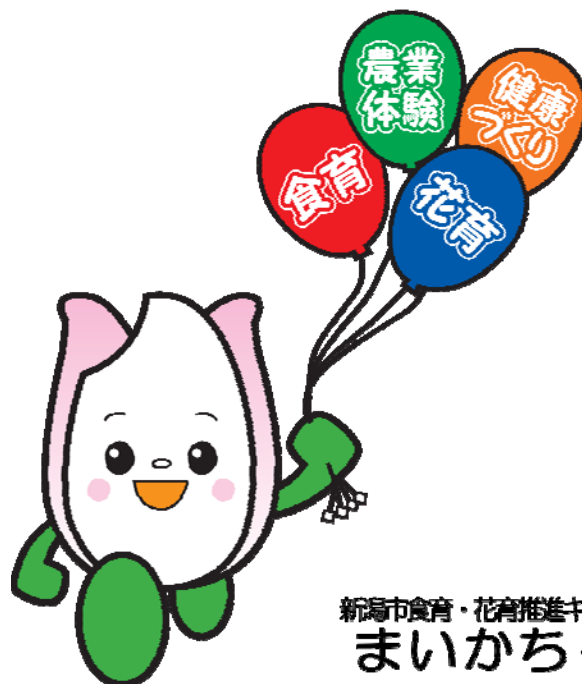
新潟市食育・花育推進キャラクター まいかちゃん