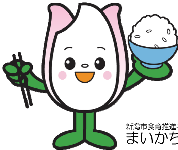
新潟市食育推進キャラクター まいかちゃん

新潟市では、そんな“まいかちゃん”を 花育の推進キャラクター としても取り扱っていきたいと考えております。