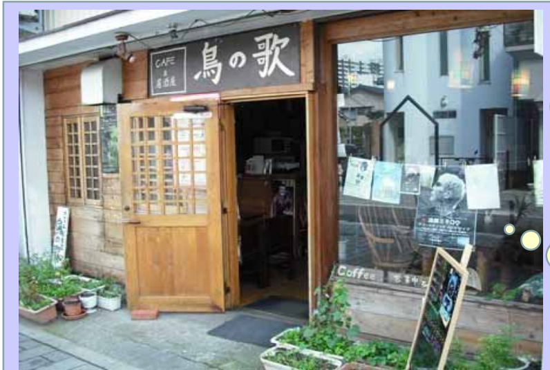
市中心部の白山神社に近く、静かな通りにある小さなお店です。