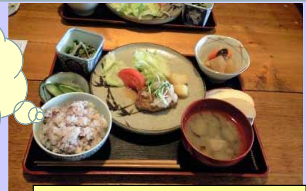
季節の野菜をいっぱい使った健康日替わりランチ