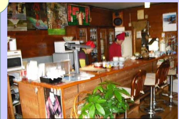
ランチの準備をするスタッフの皆さん

現在、地域のコミュニティ協議会や自治会などの各団体に、事業の趣旨を理解してもらい積極的に利用してもらうために、説明に伺っているところです。今後、多くの皆様からお店を利用してもらえるように頑張りたいと思います。