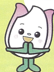
新潟市食育・花育推進キャラクター まいかちゃん

1,000円で健康状態を知ることができます。将来の自己実現にむけてまずは現在の状態を知ることがとても大切です!