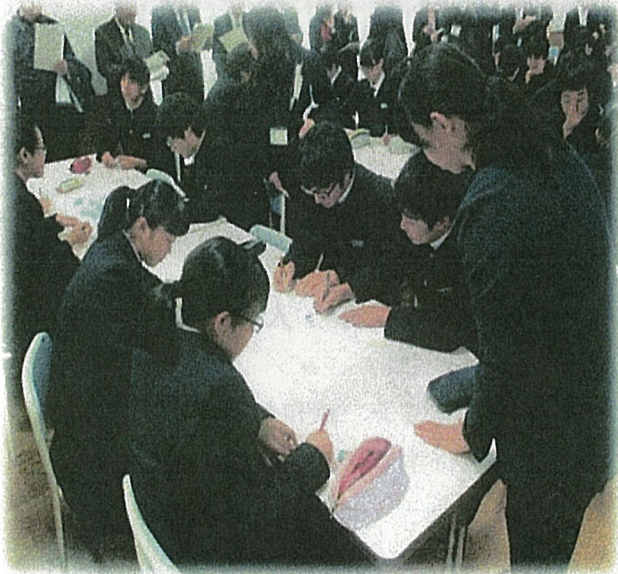
集中してがんについて考え、話し合っています。