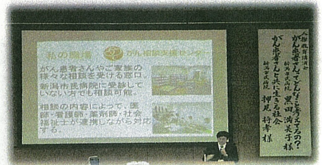
講演会 (学校行事: 人権教育)