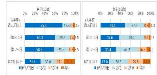
入学前の外遊びの実施頻度と現在の運動スポーツ実施率

【課題】 入学前の外遊びの実施頻度が高いほど、現在の運動・スポーツ実施頻度の高い傾向にある（右図）。 幼児が体を動かして遊ぶことを習慣化するには、保護者の意識が大きく影響するとする一方、運動・スポーツ実施に係る保護者・保育者に対する普及啓発が不足している。