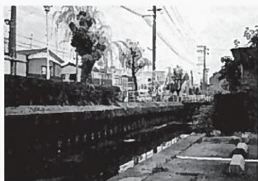
川の両側で堤防の高さが違う。 もし水があふれたらどうなるだろう。