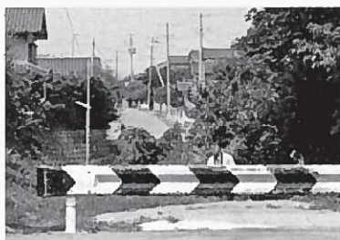
洪水の後の移転先では被差別部落の道路は沢 で分断された。