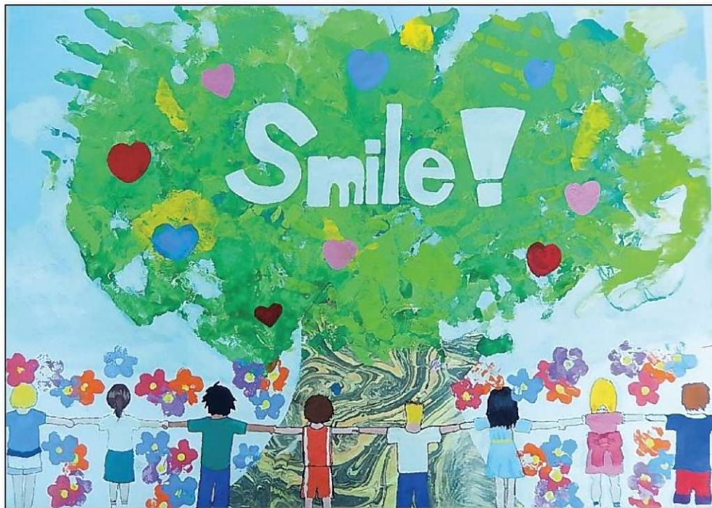
作品テーマ 「Smile! ~笑顔溢れる未来へ~」

この作品は、「世界中のみんなが仲よく手を取りあい、協力することで、笑顔に溢れる未来にしたい。」というメッセージを込めて制作しました。