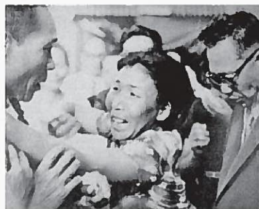
「息子をかせせ」とせまる1さんの父親とそれを 止める1さんの母親。