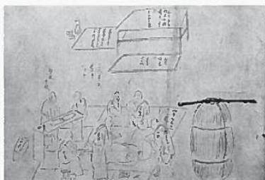
▲「長岡の腑分(人体解剖)図」より

江戸時代後期、越後(新潟県)で、被差別部落の 人々の協力のもとに、藩医自らが執刀して、腑 分(人体解剖)が行われた。この絵図には、身分 の差別をこえて、被差別部落の人々と藩医達が、 医学の発展のために協力している姿が描かれ ている。彼らの熱い思いが、日本の近代医学を 生み出す原動力となっていった。