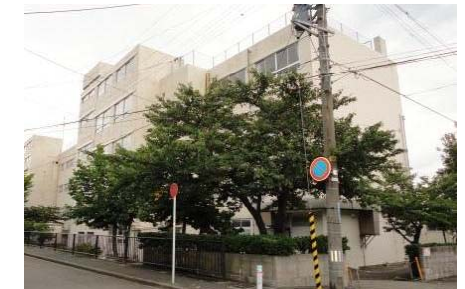
写真：建設予定地（湊小学校跡地）