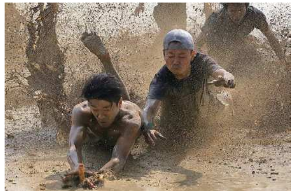
潟東どろんこカップ「どろんこフラッグ」