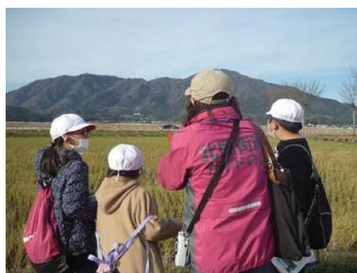
まちあるきの様子