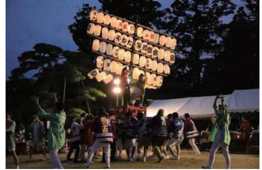
まき夏まつり「やかた竿燈」