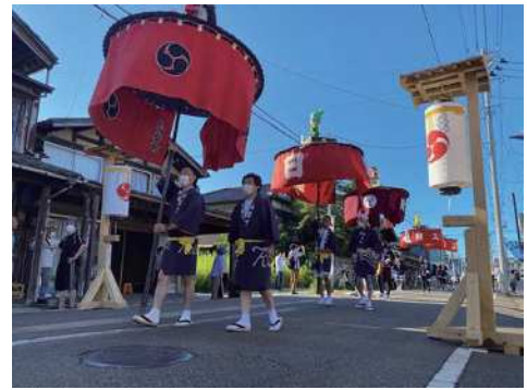
西川まつり「越後にしかわ傘ぼこ行列」