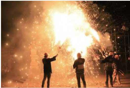
和納十五夜まつり「草花火」