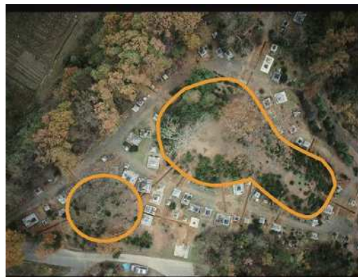
隼人塚古墳(左)・菖蒲塚古墳(右)