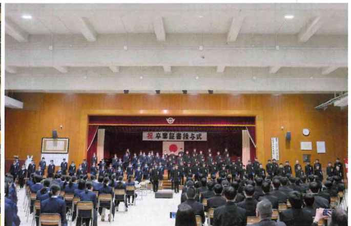
(2月26日) ▲全校生徒が揃った西川中学校卒業証書授与式