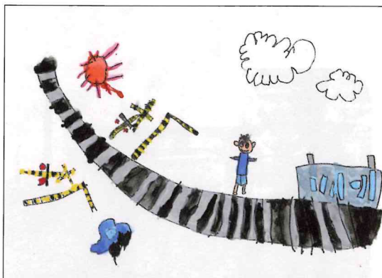
「ぼくの大好きなもの」

踏切が大好き!!特に屈切踏切が大好きだよ。大きくなったら、踏切をつくる人になりたいな。