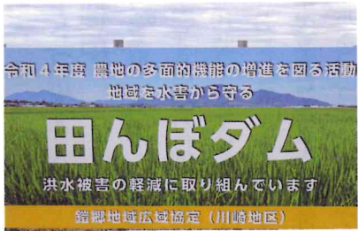
鑑郷地域広域協定(川崎地区)

川崎農家組合では排水管の先を直径10cmから5cmに落とし、水量を調整しております。地区の安全、安心のため微力ながら努力しています。