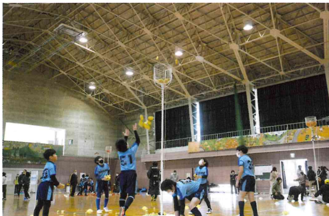
▲スポーツ玉入れ大会