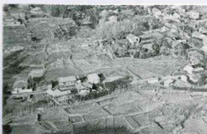
いわむろの記憶参考