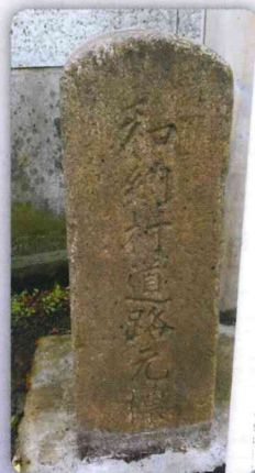
◎旧和納村（和納信号交差点角）

道路元標は直方体で大きさは縦横二十五センチ、高さ六十センチ。天辺は丸い弓型で材質は花崗岩が多く使われたと言います。