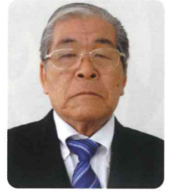
岩室地域 コミュニティ協議会

新年あけましておめでとうございます。令和三年は、新型コロナウイルスの感染拡大の中でしたが、感染防止対策を講じながら事業を進めることができました。一部事業を中止することとはなりませんが、みなさまのご支援ご協力により活力ある明るいまちづくりを推進することができました。 新しい年も、新型コロナウイルスの終息には至らないことが考えられます。また、最近では地震の発生、線状降水帯にみられる河川の氾濫等による甚大な被害も各地で続出している状態です。もしもの時に備えての各自治会による防災組織、防災訓練の必要性を改めて感じております。今後も岩室地域が明るく住み良いまちづくりのため皆さんとの協働により進めていきたいと思っておりますので、ご支援、ご協力をお願いいたします。