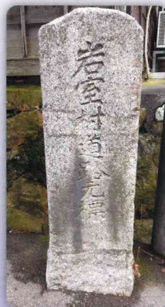
◎旧岩室村（岩室温泉信号角）