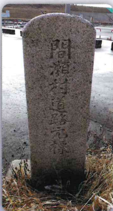
◎旧間瀬村（間瀬漁港入口）

私たちの周辺には、かつての暮らしに関わりの深い石仏や記念碑など長い年月の間に忘れ去られたものがたくさんありますが「道路元標」もそのひとつです。道路元標は、大正八年（一九一九）に施行された旧道路法で「各市町村に一個を置く」ことが定められ市町村役場の前や主要な道路の交差点などに設置され、市町村道路の基準点になりました。 しかし、昭和二十七年施行の新たな道路法により大正時代の旧道路法は無効となり、起終点としての役割を終え次第にその姿を消していきました。今では、「○○村道路元標」と石に刻まれた文字は風化し、時の流れを映し出しています。道路幅幅などで現在の場所に落ち着くまでの形跡もうかがわれます。こうして一度は失われかけた道路元標が「和納村道路元標」「岩室村道路元標」「間瀬村道路元標」と刻まれて三基が遺り、歴史の生き証人としてその姿を留めています。かつての町の様子を知ることができるとなる道路元標は、貴重な文化遺産として後世につなげたいものです。