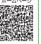
▼国税庁ホームページ