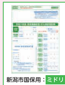
新潟市国保用：ミドリ

加入中の 健康保険証 により、 受診券が異なります 。保険証と色が合っているか確認してください。