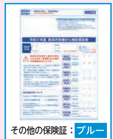
その他の保険証：ブルー