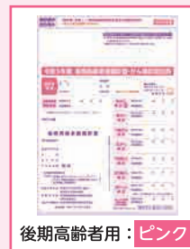
後期高齢者用：ピンク