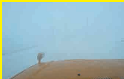
▲地吹雪発生時の車内からの視界

過去の状況を踏まえ、地吹雪で立ち往生した箇所や一時通行止めにした箇所には、地吹雪発生時通行注意の看板を設置しています。通行の際は注意してください。