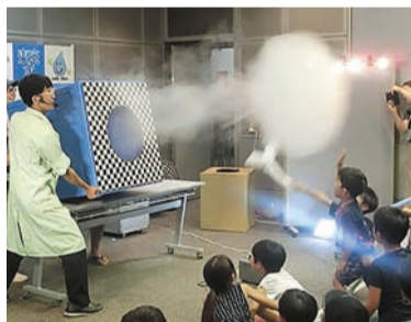
らんま先生 空気砲の実演

☎10月23日(土)午後1時半~3時 場巻西川多目的ホール(西川図書館内) 内エコ実験パフォーマンスショー 講師 らんま先生(環境カウンセラー) ☑小学生(保護者同伴可)抽選100人 ☎市役所コールセンター(☎025-243-4894) 受付時間 午前8時~午後9時 申込期間 受付中~10月10日(日) ※申込期間終了後、抽選を行って結果を通知します ☎区民生活課生活環境係(☎0256-72-8312)