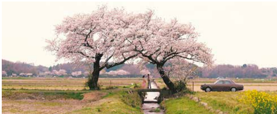
↑「ハモニカ太陽」のワンシーン

「短篇映画にしかん」「ハモニカ太陽」「ボケとツッコミ」の3作品があります。作品すべてをYouTubeで公開中です。ぜひご覧ください。