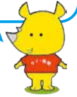
新潟市ごみ減量推進キャラクター サイチョ

西蒲区は全市と比べるとごみ量は多いけど、3年連続で減っているね!!このまま減らそうね。