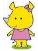
サイチョの妹 クルリ

【燃やすごみ】の袋にびんや缶を入れたらダメ!! 洗って資源として出しましょうね。