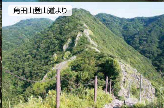
角田山登山道より

外出する際は屋内外を問わず人との距離を可能な限り2m以上確保し、マスクを着用するなどして新型コロナウイルス感染予防に努めましょう。また、こまめな手洗い・手指消毒を心がけましょう。