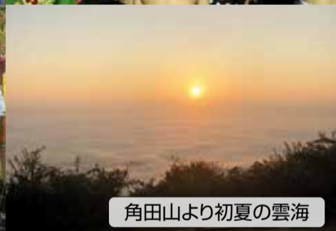
角田山より初夏の雲海