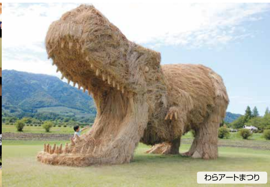
わらアートまつり