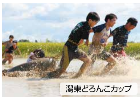
潟東どろんこカップ

写真はいずれも昨年度以前のものです。 掲載した催しの中には今年度の開催中止が決定しているものも含まれます。