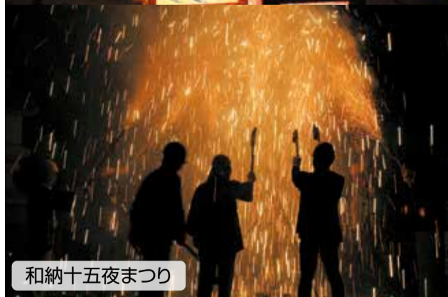
和納十五夜まつり