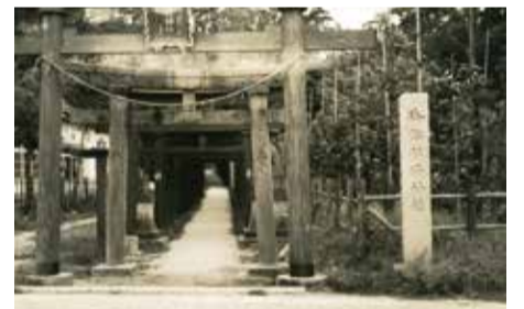
拝殿が高台にあったころの青山稲荷神社

神社の祭事は毎月1日に開催されており、ときどき心地よい太鼓の音が聞こえてきます。年末から新年にかけての二年参り、2月の豆まき、5月8日の春季大祭では多くの人で賑わっています。