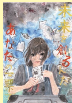
明るい選挙啓発ポスター 市優秀賞/県佳作

区役所、出張所の開庁時間中は駐車場が大変混雑します。午後6時以降は比較的駐車場に空きがあります。