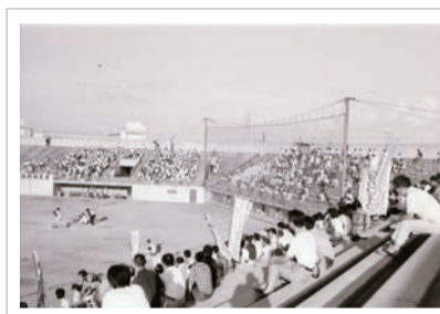
昭和52年8月7日 新潟市早起き野球大会・決勝