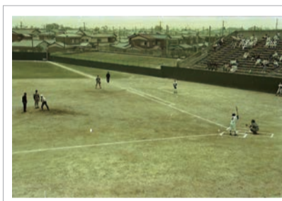
昭和59年5月26日 横浜高校招待試合・始球式