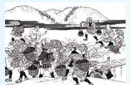
「内野砂山堀割之図」の模写図