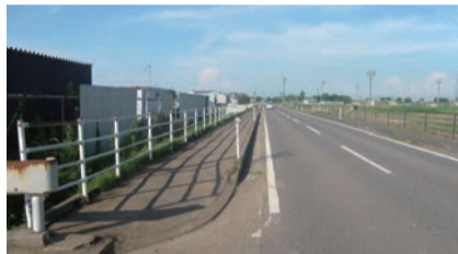
作業の様子(上)と作業後の道路(下)