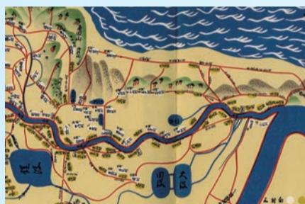
▲左から鎧潟、田潟、大潟が並んでいる