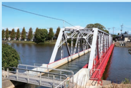
▲現在の西川水路橋