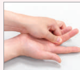
採血する指を圧迫します