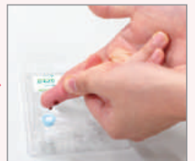
指定の容器に血液を採取します

④血液を採取した容器を、すぐに同梱の遠心分離機にかけます。その後冷蔵保存し、当日または翌日に問診票を同封して返送してください。