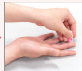
専用の器具で指の側面に針を刺します