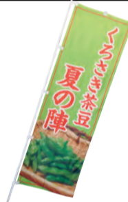
▲会場はこののぼりが目印です