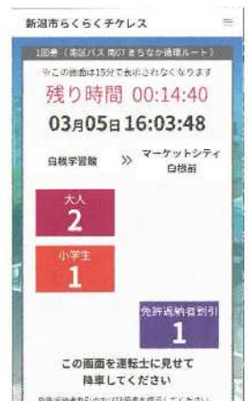
⑧ 「降車画面」を運転士に提示し降車