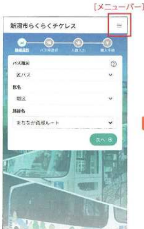
② 路線確認(自動入力)