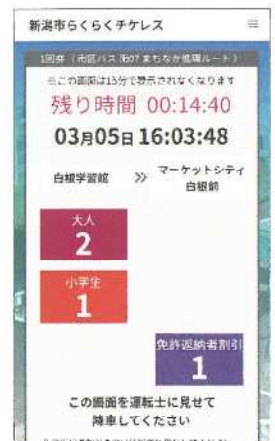
③ 「降車画面」を運転士に提示し降車