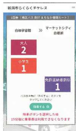
⑦ 降車時に「降車する」をタップ