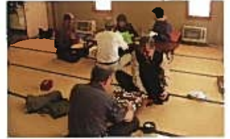
お茶の間(囲碁・折り紙)