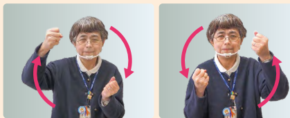
①ハンドルを握って左右にグルッグル!っと半回転ずつ動かします