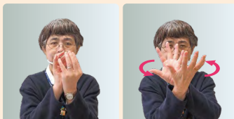
①両手でつぼみを作り手をひねりながらつぼみを開く