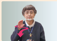
②軽く物をつかむように手を構えて蛇のようにクネクネさせて前へ出す