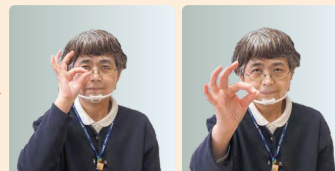
②親指と人差し指をくっつけてのぞきながら顔の前に出す