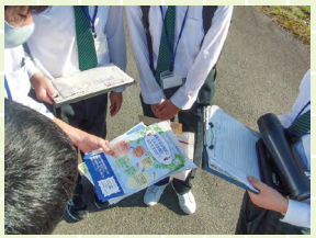
昨年度実施した「健診おすすみチラシ作成・配布」の様子と「南区仕事人図鑑」